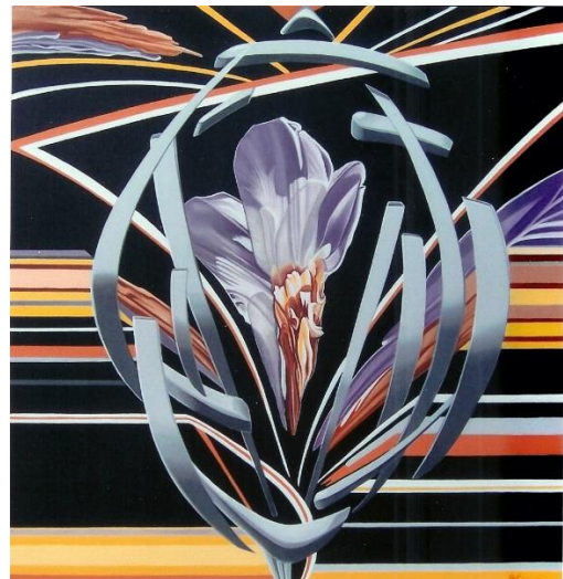
« Autoérotisme »