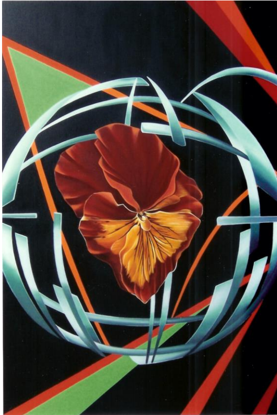
« La pensée de la ville étoile »

Blog disponible : http://marie-christine-camus@skyrock.com